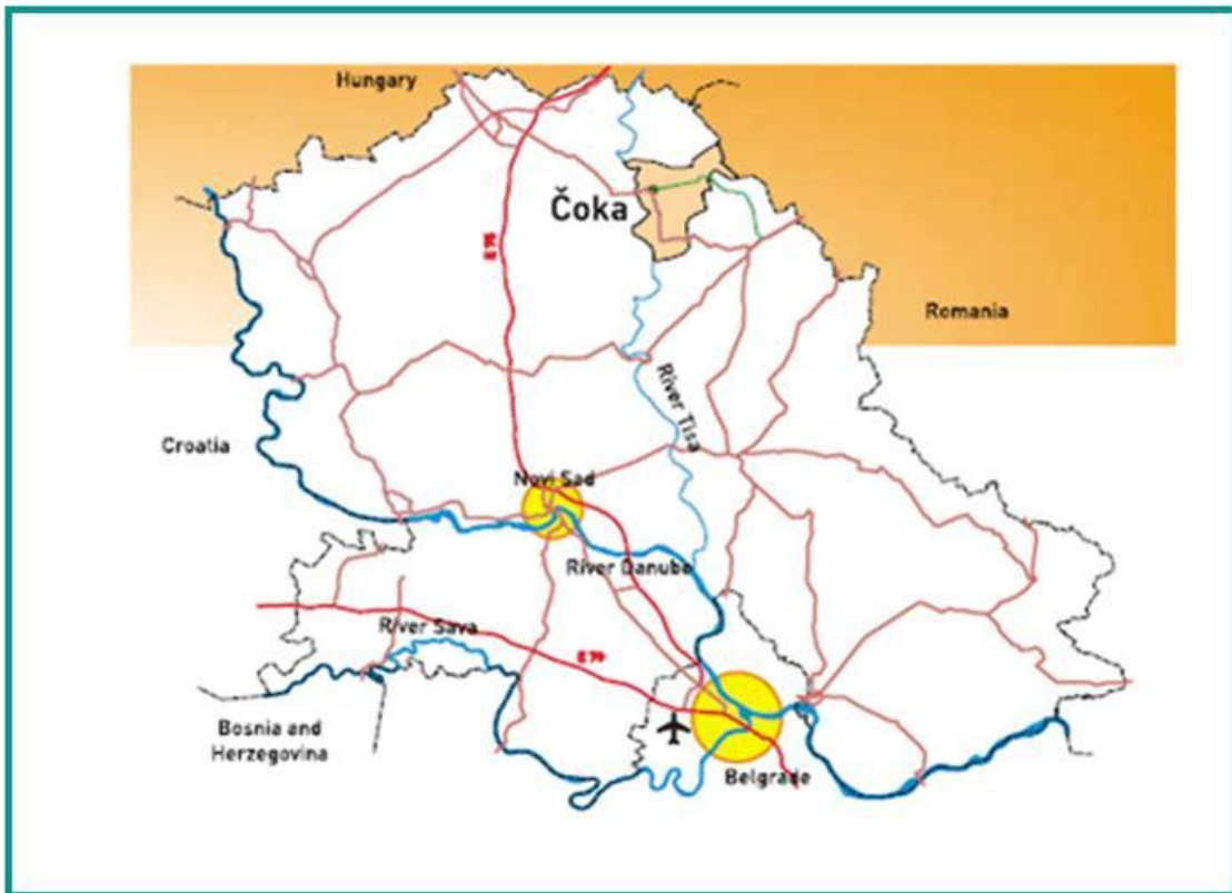
Karta 1. Položaj Opštine Čoka u regionu

Na istoku jednim delom izbija na državnu granicu prema Rumuniji.