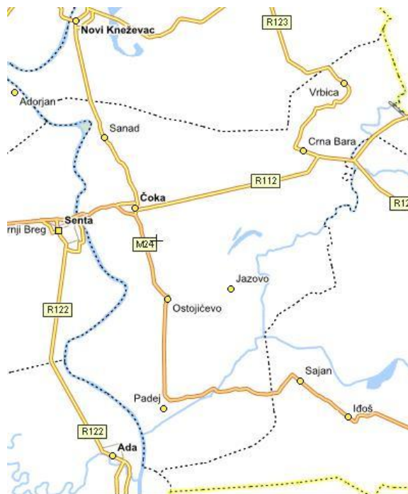
Karta 2. Položaj naselja u Opštini Čoka

Opština Čoka prema popisu stanovništva (Popis stanovništva, domaćinstava i stanova u Republici Srbiji 2011 –prvi rezultati, Republički zavod za statistiku ) broji 11388 stanovnika i ukupan broj domaćinstava je 4678 za razliku od popisa stanovništva iz 2002 .g. kada je Opština Čoka brojala 13832 stanovnika,apsolutni pad 2011-2002 je -2444 .